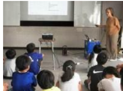
出前授業の講師を務める「秘すれば花」さん

「環境とは何?」と動いてみて、「Think globally, act locally」ということらしいことが分かる。それならばと、分かる様な分からない様な事をやっているうちに、「アース・エコ」は良き人の良き力に育てられて来た。さて、これからも「アース・エコ」が楽しく集う人に育てられる様に、老若男女の良き縁を待ち望むことしきりの、今日この頃。