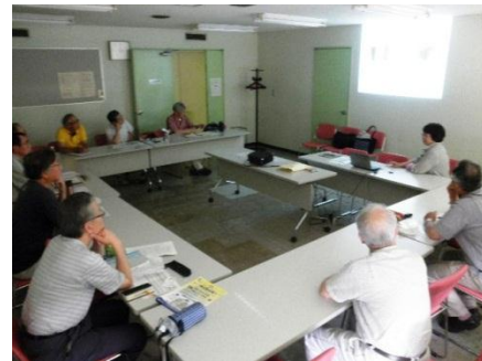
報告する会員とそれを聞く参加者

◇ 会員が参加したセミナーで紹介のあった温度差発電の実験セットについて、報告がありました。