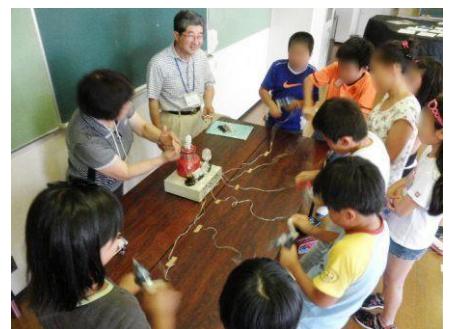
省エネ実験:40W 人力発電

省エネカレンダーは、先生を通して夏休み明けに回収します。1日だけの授業実施でしたが、どのような結果が出るのか楽しみです。