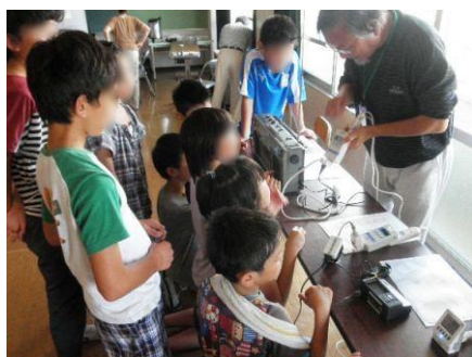
省エネ実験:待機電力測定