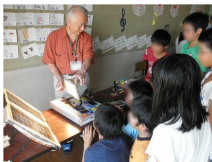
自然エネルギー実験:太陽光発電