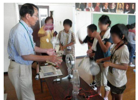
自然エネルギー実験:風力発電