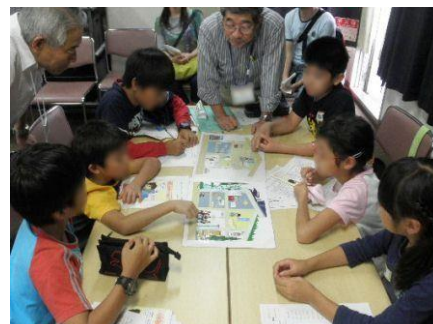
インターンシップ学生も実験に参加